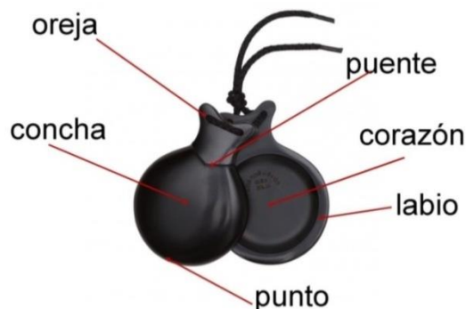
Imagen: "Partes de la castañuela". (Castillero, 2019)